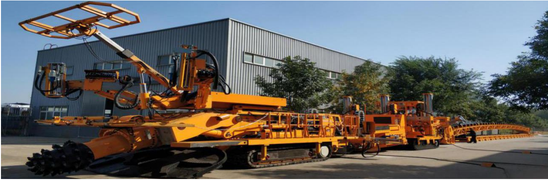
掘锚机+锚杆转载机组+加长二运