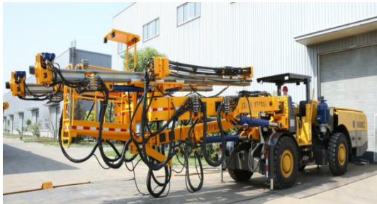
LCM3-110 两臂轮式隧道锚杆台车