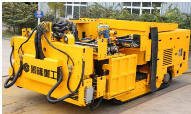
六臂帮锚杆顶锚索钻车