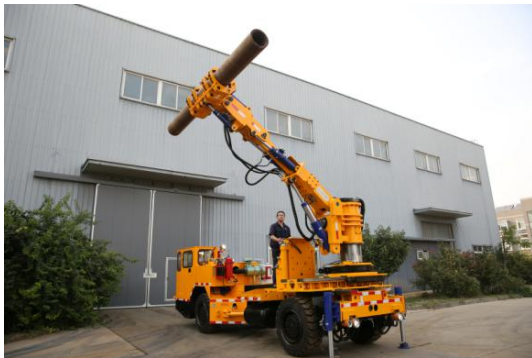
防爆柴油机管路抓举车