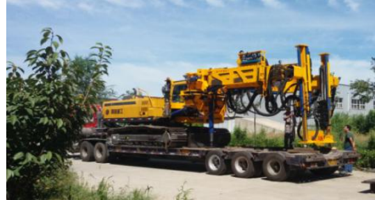
DCM2-90 两臂履带式隧道锚杆台车