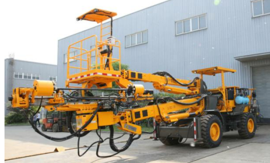
LCM2-76 单臂轮式隧道锚杆台车