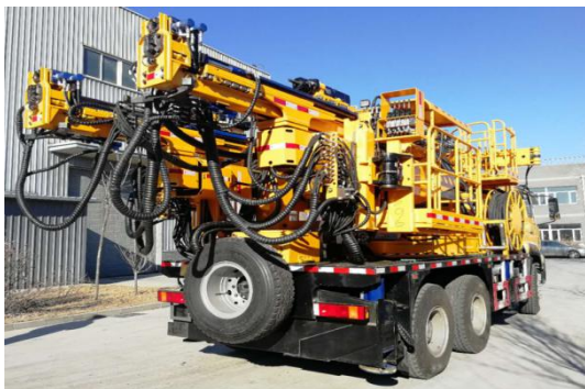
LCM3-120 多功能机械化隧道支护台车