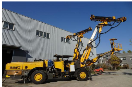
LZT3-110 两臂轮式自动化隧道锚杆台车