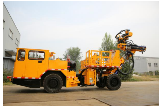
防爆柴油机管路钻车