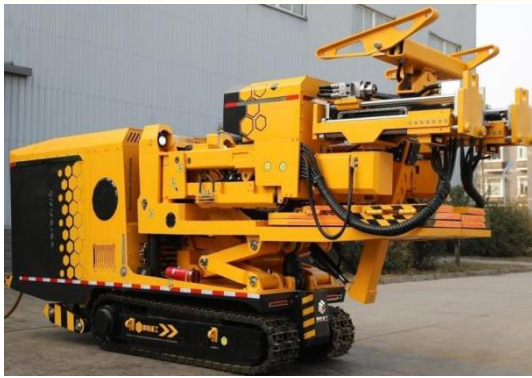
半自动两臂锚杆钻车