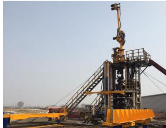
石油井口起下管机械手（二代）