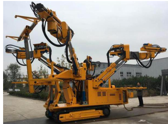
紧凑型四臂锚杆钻车