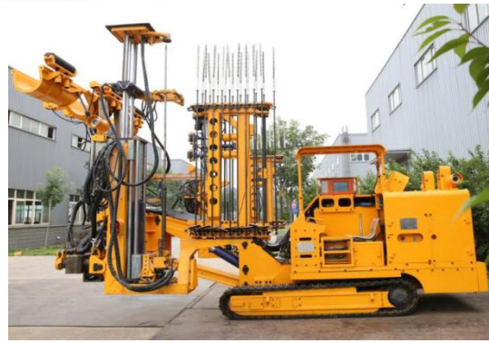
全自动两臂锚杆钻车