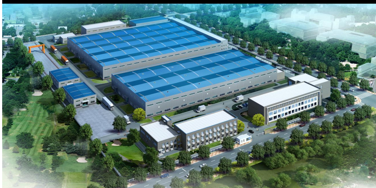
景隆重工生产基地鸟瞰图