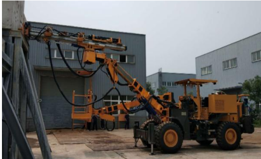
LCM2-50 单臂轮式隧道锚杆台车