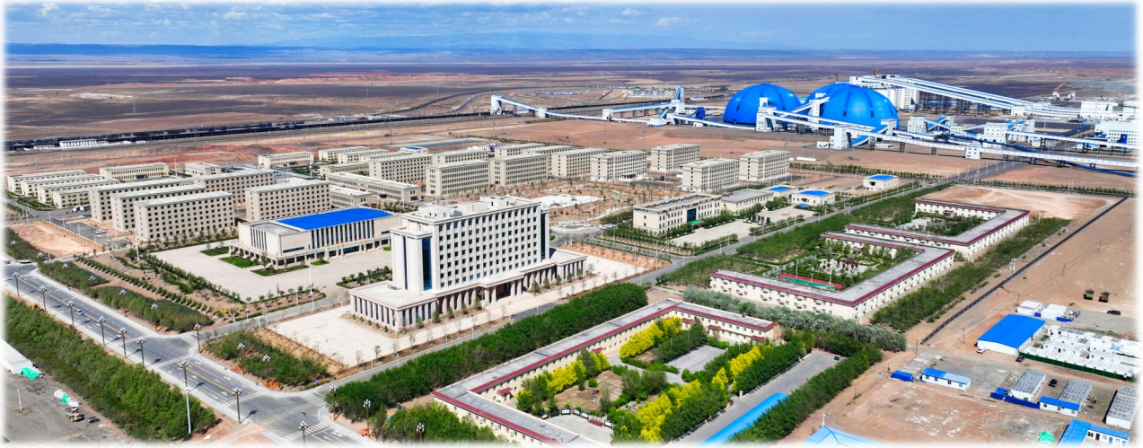
上图：将军戈壁二号露天煤矿园区全景图