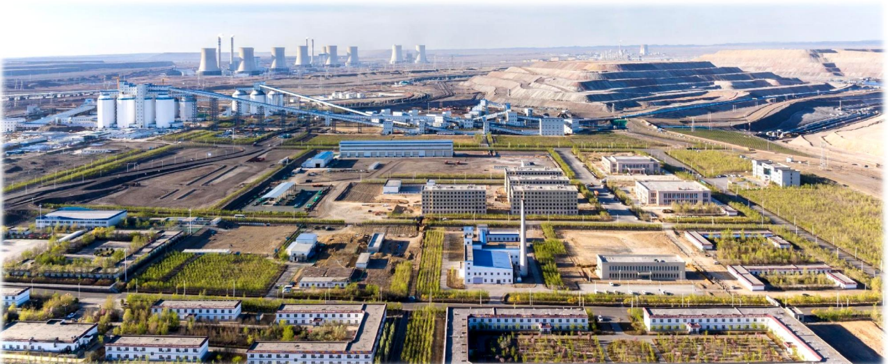
上图：南露天煤矿园区全景图