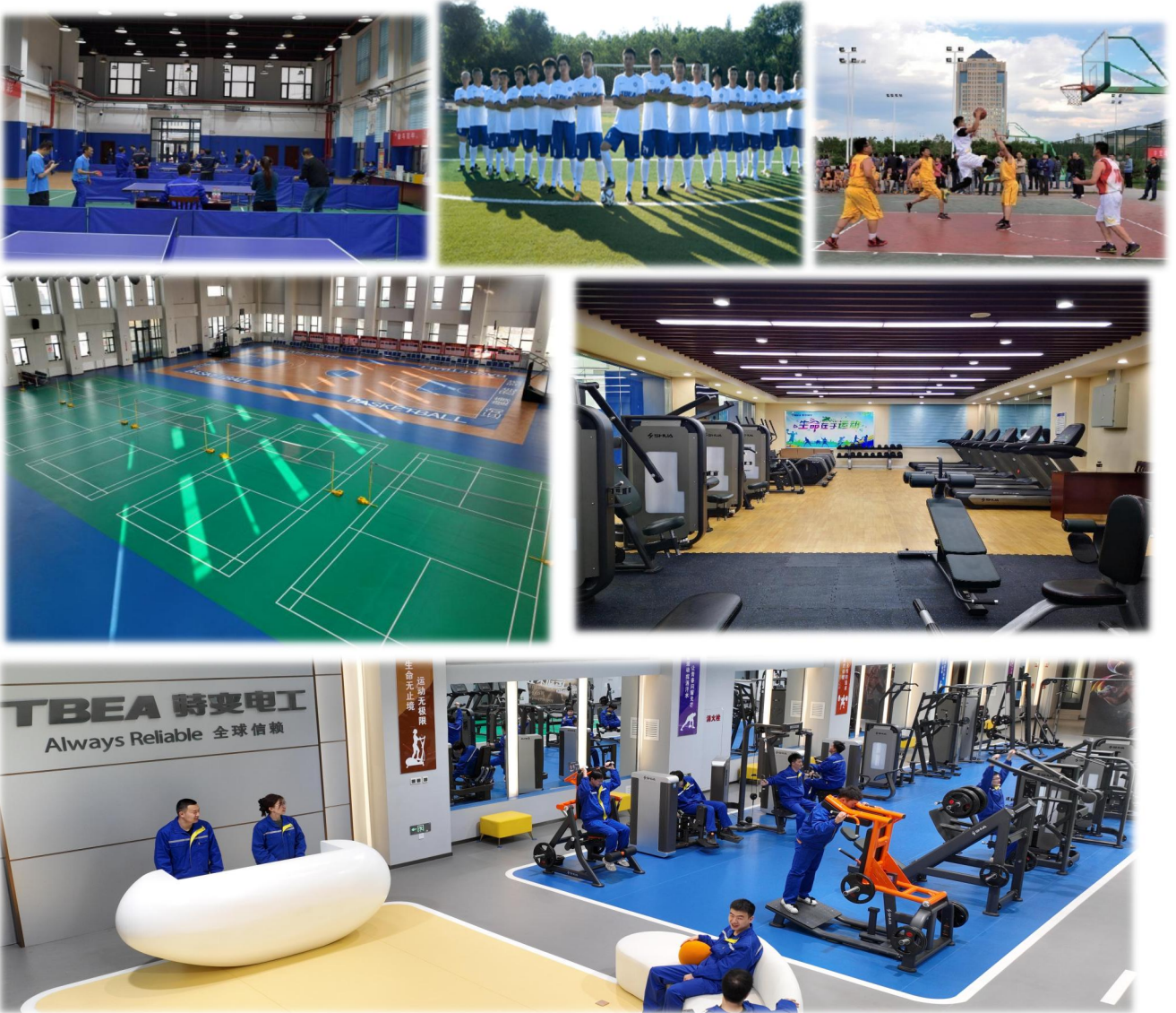
上图：室内健身、运动场所（羽毛球、篮球、乒乓球）