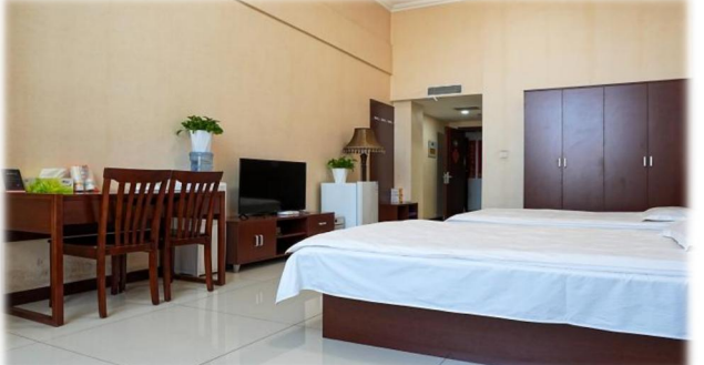
上图：食宿环境（商务区及项目公司）